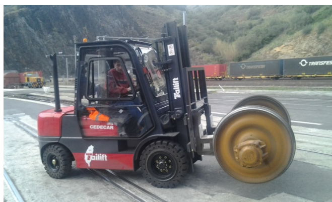
Carretilla TAILIFT modelo FD35 con cabina

La carretilla que ha adquirido ahora TRANSFESA es el modelo TAILIFT FD35 de 3.500 kgs de capacidad de carga nominal con mástil standard de 3,3 m de elevación y una cabina cerrada, totalmente acristalada y equipada